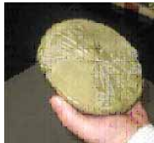
A la izquierda: La inscripción tallada en esta tablilla del año 700 antes de Cristo describe la caída del meteorito que pudo destruir Sodoma y Gomorra.

Científicos de la Universidad de Bristol dicen ahora que, con Dios de por medio o no, lo de Sodoma y Gomorra fue cosa de un meteorito y sitúan la fecha del impacto con insólita precisión el 29 de junio del año 3123 antes de Cristo. En realidad, se trata de una deducción en cadena que parte de una tablilla de arcilla que se exhibe en una de las salas del Museo Británico.